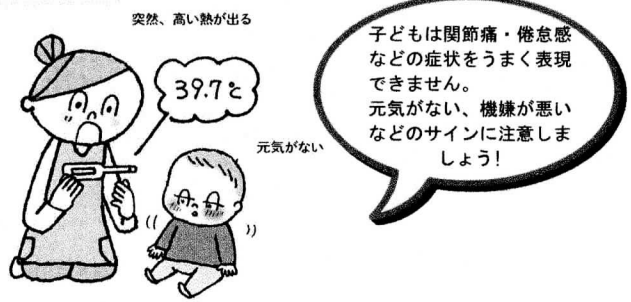
突然、高い熱が出る

症状 インフルエンザの特徴は、突然高い熱が出ることで、流行しやすいこと。医療機関では検査キットですぐに診断できるのでインフルエンザが疑われたら、速やかな受診が大切です。